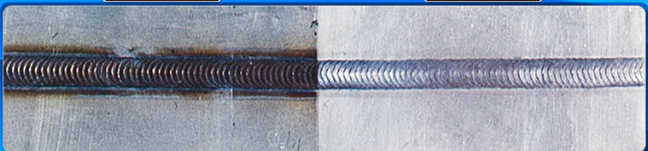
■メタクリーン使用後の面