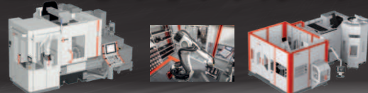
RS05-2ロボットシステム RS2ロボットシステム